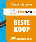
Fongers Supreme Disc 522 Wh