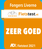
Fongers Livorno Dames 522 Wh